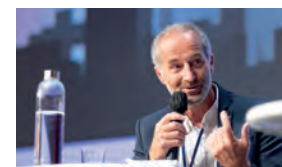
MICHEL DESJOYEUX , navigateur français