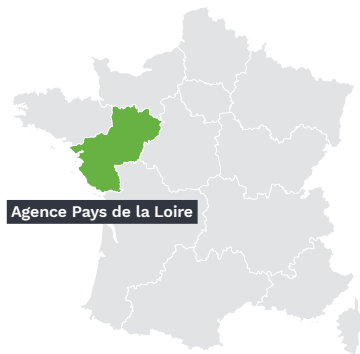
Agence Pays de la Loire

Sensibiliser au DUER reste d'ailleurs le thème principal et récurrent des actions menées sur le terrain auprès des adhérents des organisations professionnelles du BTP. Cette année, 322 réunions d'information ont été conduites avec la FFB, la CAPEB, la FNSCOP BTP (Fédération nationale des SCOP du BTP) et la FNTP, regroupant près de 4 135 participants. Si le DU tient le haut du pavé, d'autres sujets comme les travaux en hauteur, Prévention et performance, le risque routier ou encore les EPI, sont en bonne place. Les entreprises, notamment les plus petites, ont aussi bénéficié d'accompagnements personnalisés, notamment via le digital, de diagnostics et d'actions ponctuelles qui participent à développer plus largement une véritable culture prévention.