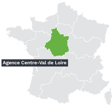
Agence Centre-Val de Loire