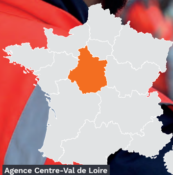
Agence Centre-Val de Loire